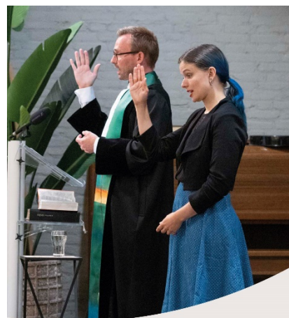
Preken in gebarentaal

Op 7 juli collecteren we voor het Pastoraat van PKN: Preken in gebarentaal. Dove mensen voelen zich vaak eenzaam en onbegrepen in gewone kerkelijke gemeenten. Hun visuele dovenwereld is een totaal andere dan de horende woordenwereld. Daarom is er binnen de Protestantse Kerk categoriaal pastoraat voor doven. Speciaal opgeleide dovenpastors helpen dove mensen om de weg met God te gaan, bijvoorbeeld in dovendiensten met gebarentaal. Dovenpastors maken deel uit van het Interkerkelijk Dovenpastoraat dat hen helpt zo goed mogelijk invulling te geven aan kerkelijk werk onder dove mensen. Met uw gift aan de collecte ondersteunt u het pastoraat aan dove mede-gelovigen, die net als wij allemaal pastorale aandacht, troost en bemoediging nodig hebben in tijden van vreugde en verdriet.